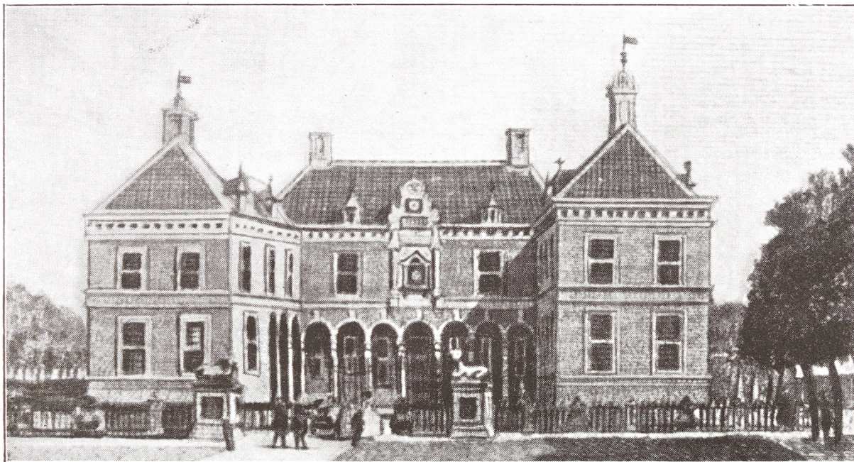
De Ehze Ao. 1743.

Afbeelding: "Uit Gorssel's verleden" door J. de Graaf.