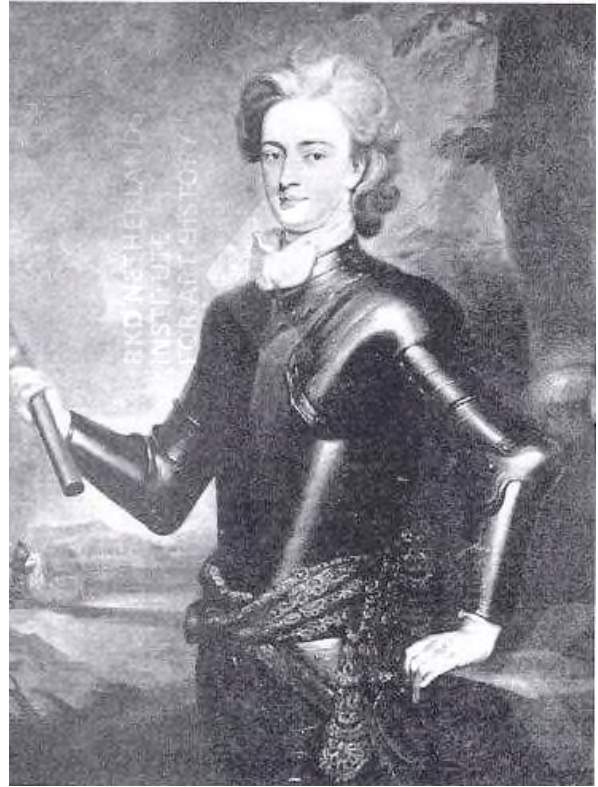
Arnold Joost van Keppel