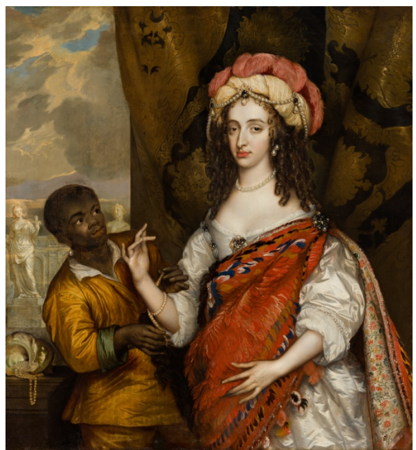
Maria Stuart 1662-1695 echtgenote van Koning-Stadhouder Willem III