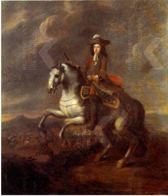
Willem III te paard