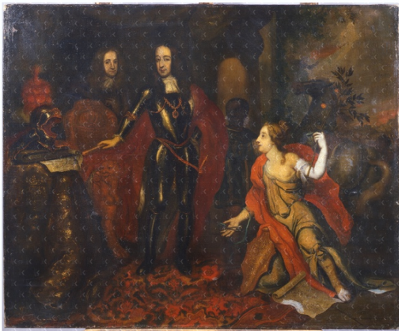
Koning-Stadhouder Willem III 1650-1702 met zwarte page