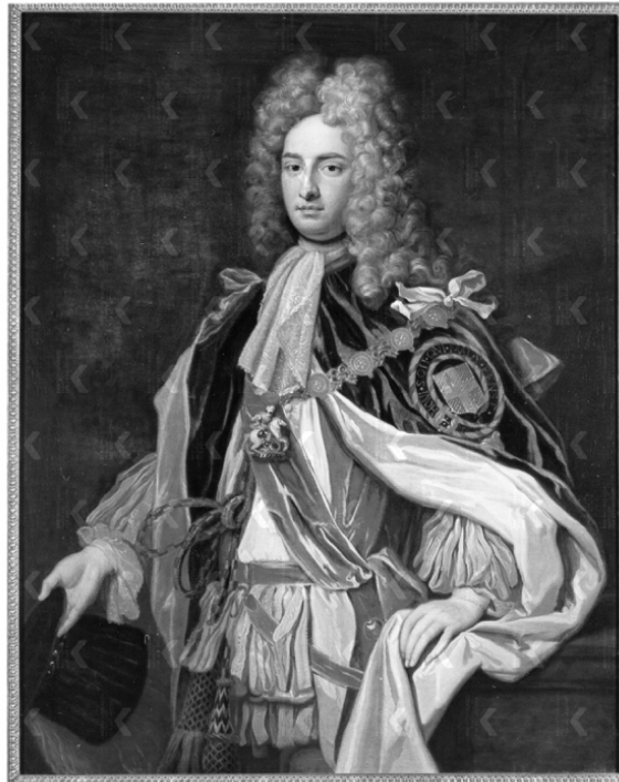
Arnold Joost van Keppel Graaf van Albemarle